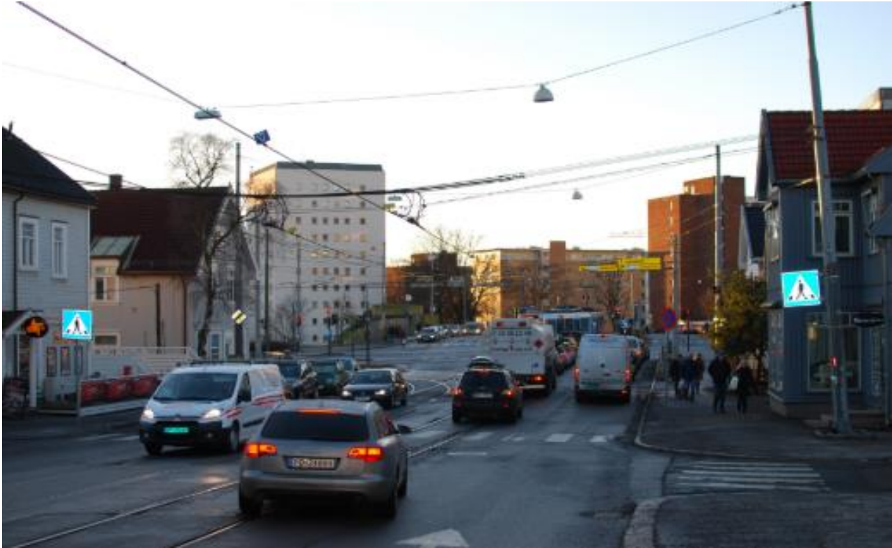
Her ser du Storokrysset før rehabiliteringen begynte

Rehabiliteringen handler om at de skal gjøre veien bedre enn den var før. De skal rehabiliterer helt opp til Kjelsås.