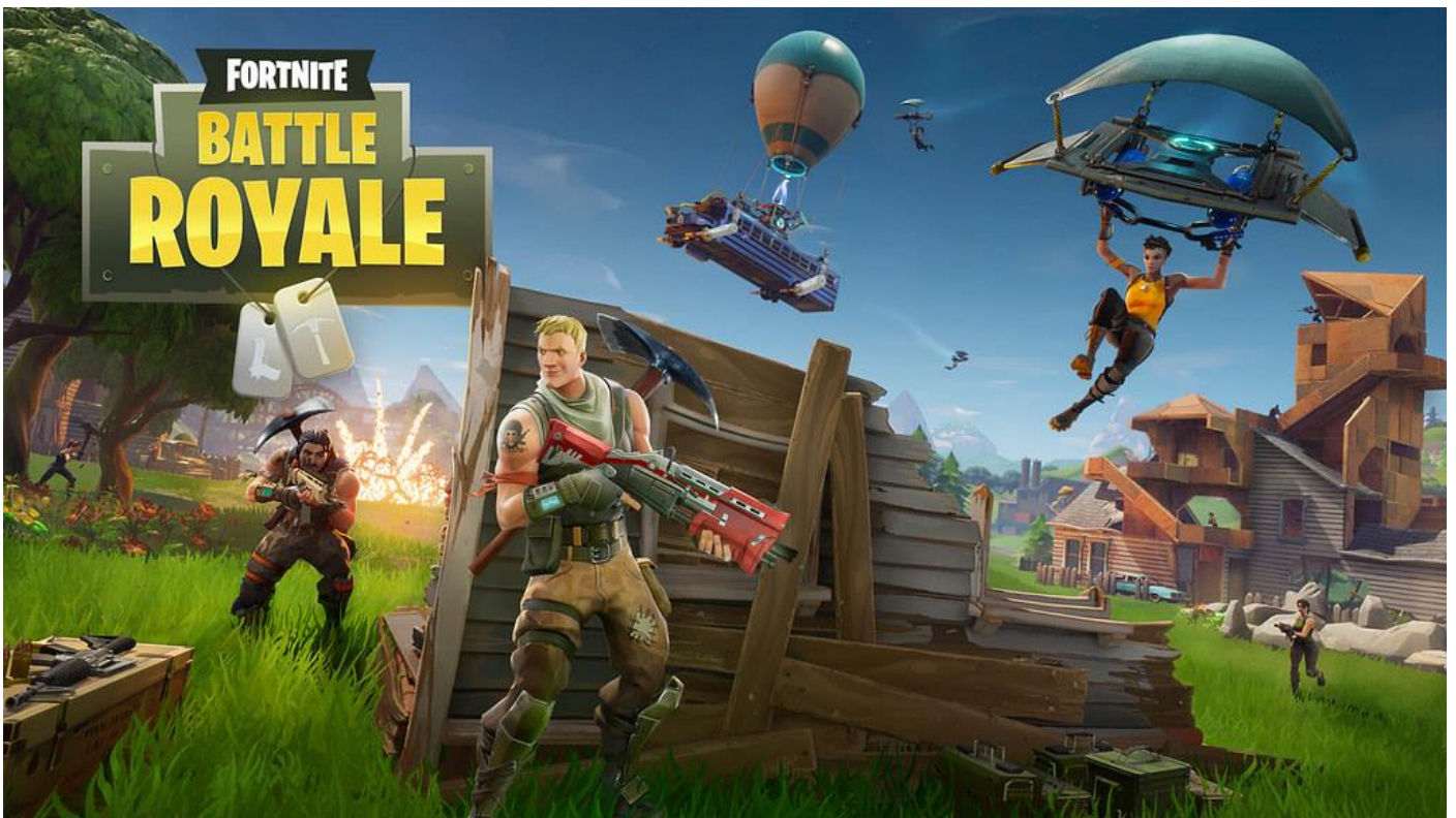
Bilde: Fortnite spillere som skyter