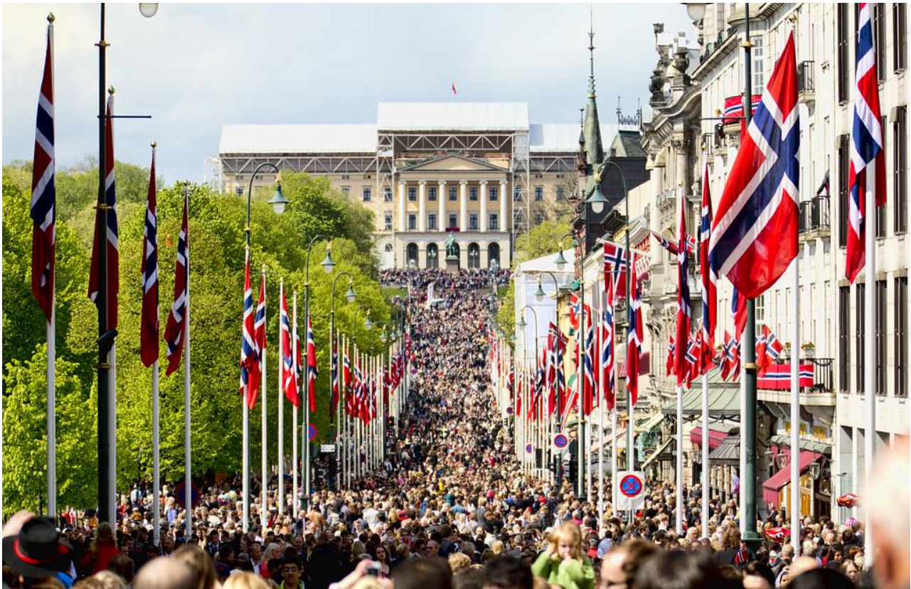
Bildet er tatt foran slottet på 17.mai

Mange elsker 17. mai og synes det er koselig å feire den på Disen skole. Disen skole har et opplegg på morgenen og et på ettermiddagen.