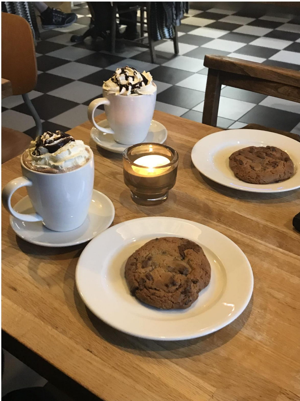
Fantastisk cookie og kakao.

Vi gir denne kafeen terningkast 6 for god service, kjempegod mat og lekre omgivelser.