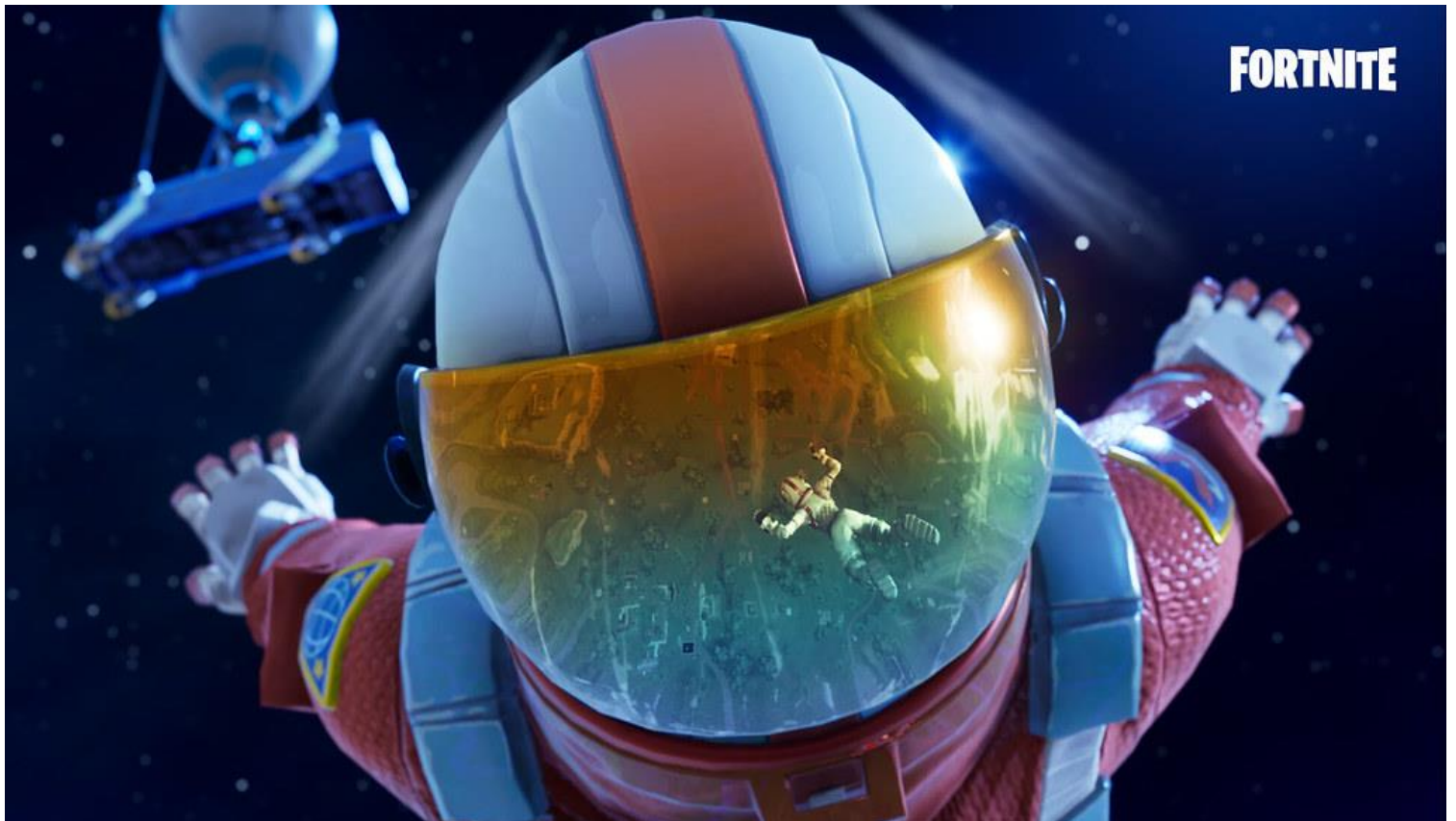
BILDE: Fortnite spillere som glider nedover